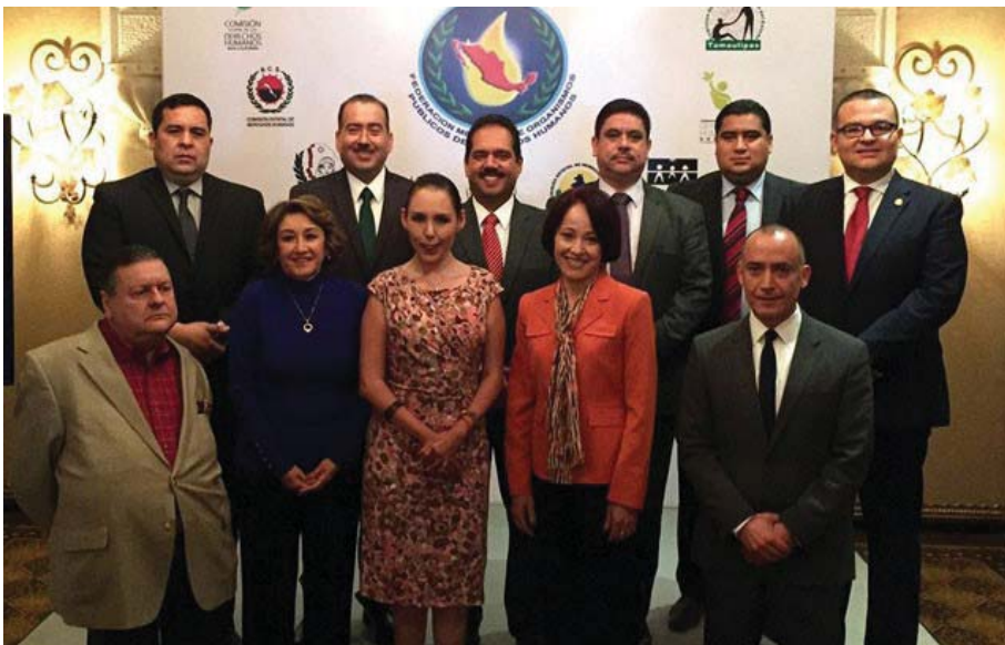
Reunión de integrantes de las Defensorías de la Región Norte de México, celebrada en marzo de 2016. en Coahuila.

Sin embargo, el presente aspecto que fue tomado en cuenta, muestra cuáles son las leyes y reglamentos que existen en los ocho estados de la región norte de México que protejan personas en contexto de migración independientemente de aquellas que emanan del derecho internacional o nacional antes mencionado.