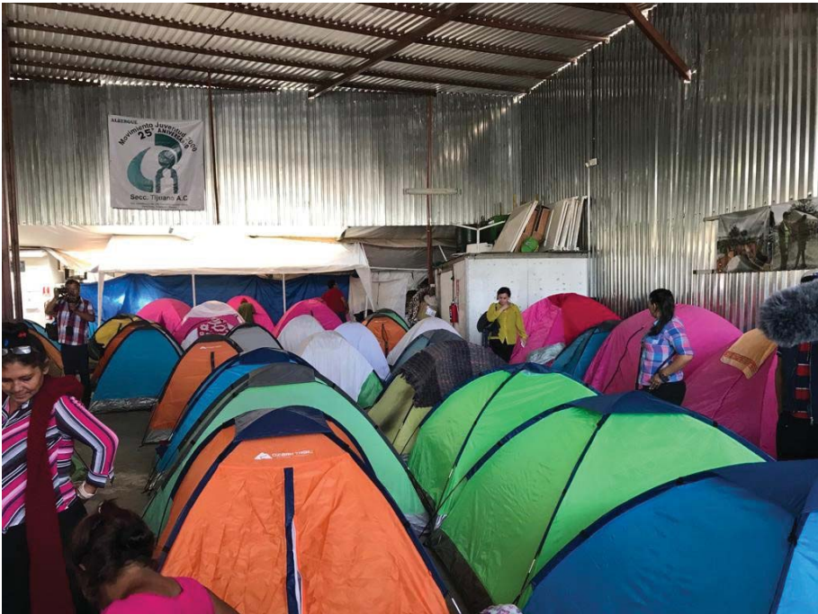
Caravana de personas en contexto de migración procedentes de Centroamérica, arribando al Albergue Juventud 2000, en abril de 2018, en Tijuana, Baja California.