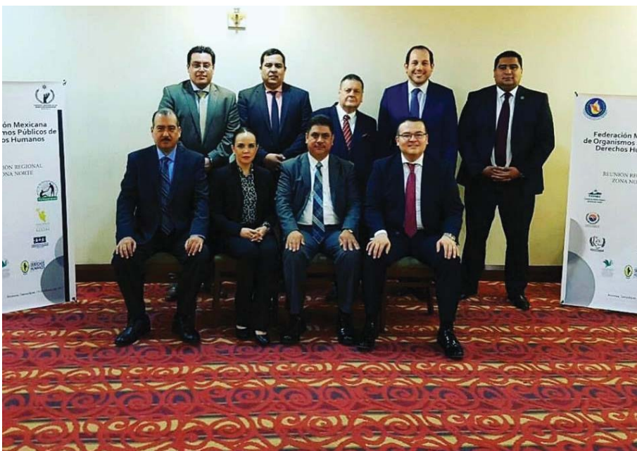
Reunión de integrantes de las Defensorías de la Región Norte de México, celebrada en febrero de 2017, en Tamaulipas.