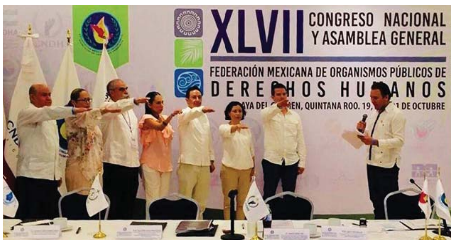
Reunión de integrantes de las Defensorías de la Región Norte de México, celebrada en octubre de 2017, en Quintana Roo.

Es importante capacitar a una mayor cantidad de personal para la atención de la población en contexto de migración, y generar estrategias para la atención de gestiones y orientaciones en la materia, ya que por la naturaleza de las violaciones, en algunos casos en diversos puntos de su trayecto, resulta complicada la integración e investigación de los expedientes de Queja. Debido a esto, también es necesario contar con áreas específicas ya sea Visitadurías o Coordinaciones, así como Programas con presupuesto asignado para la atención del tema.