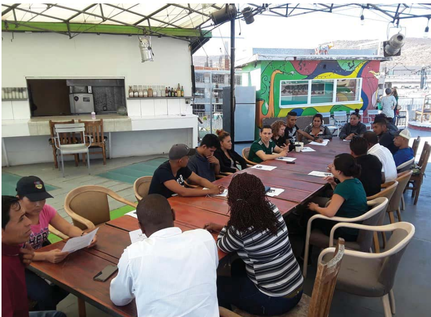
Plática sobre "Derechos Humanos de Personas en Contexto de Migración" impartida por personal de la CEDHBC ante Espacio Migrante en junio de 2018, en Tijuana, Baja California.