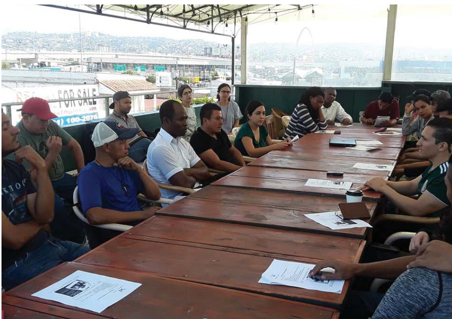
Plática sobre "Derechos Humanos de Personas en Contexto de Migración" impartida por personal de la CEDHBC ante Espacio Migrante en junio de 2018, en Tijuana, Baja California.