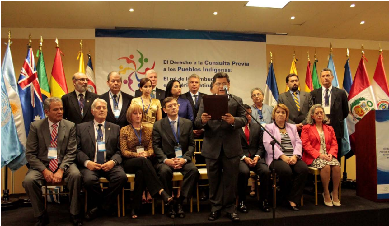
Lectura de la Declaración de Lima