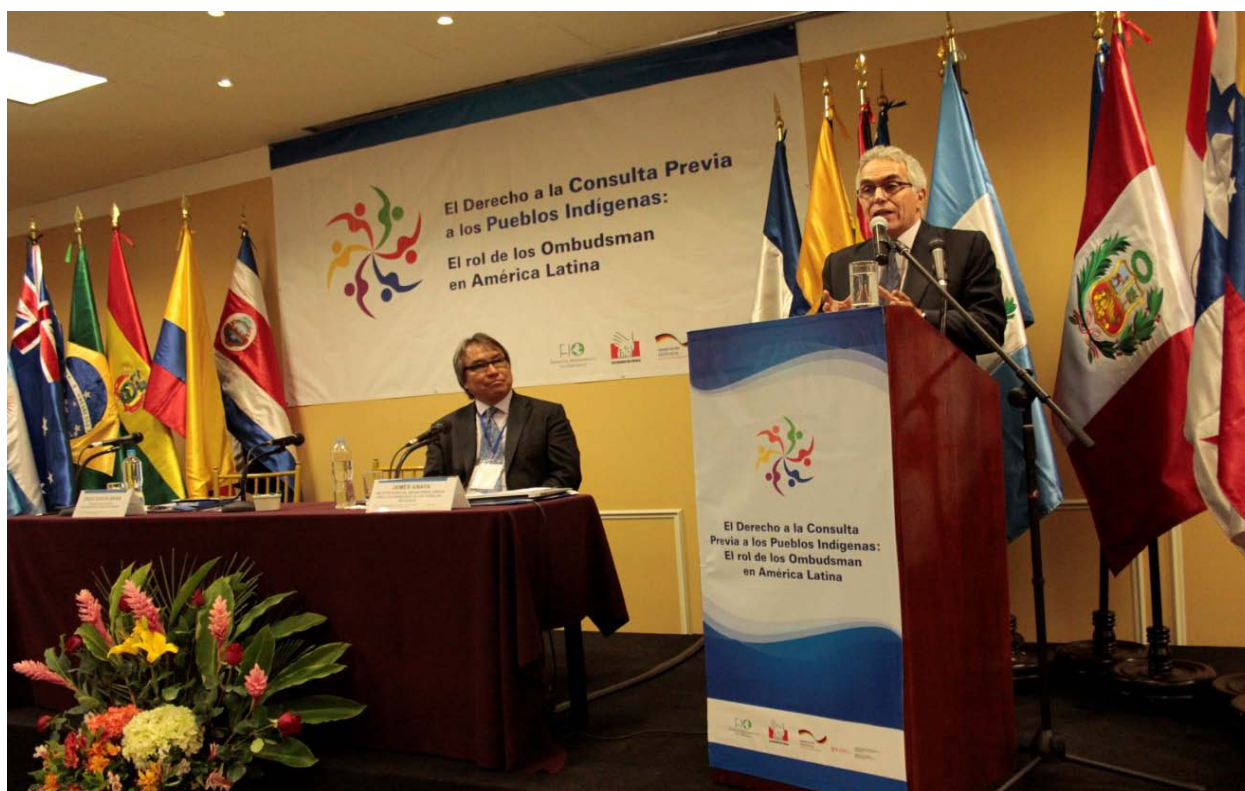
Conferencia magistral sobre derecho internacional: James Anaya, Diego García-Sayán

Hemos avanzado a un punto en que no se discute si hay o no sentencias vinculantes. Pero la armonización de instituciones sociales, políticas y administrativas se ve rebasada por expectativas y demandas contradictorias. La situación es positiva porque los derechos y voluntades democráticas están establecidos. Hay conflictividad en este terreno, pero no cabe duda que las Defensorías pueden afinar mecanismos institucionales para lidiar con ello.