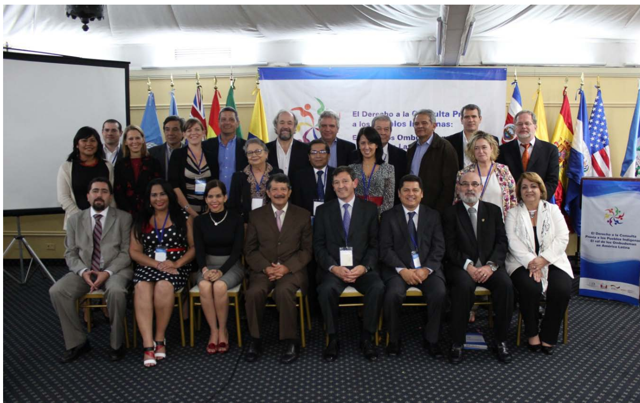
Retrato final de los participantes de la FIO con el equipo de apoyo de la GIZ

Por otro lado, está el derecho a la participación ciudadana. Es un proceso muy reciente, del 2002 hacia adelante, con algunas mejoras pero tenemos el reto de mejorarla y procurar que influya y genere espacios propicios para los momentos de la consulta previa.