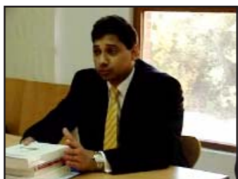
Ricardo Vargas Defensor del Pueblo de Panamá

Luego de la discusión sobre temas relevantes en materia de las relaciones entre estas instituciones y el PRADPI, se firmaron acuerdos de cooperación y asistencia mutua con el objetivo de fortalecer y mejorar la defensa y promoción de los derechos humanos en el ámbito iberoamericano.